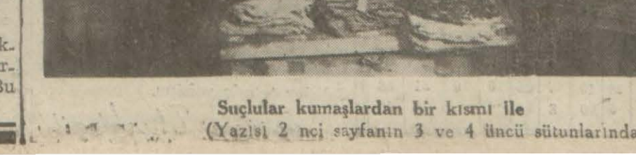
Suçlular kumaşlardan bir kısmı ile (Yazısı 2 nci sayfanın 3 ve 4 üncü sütunlarında)