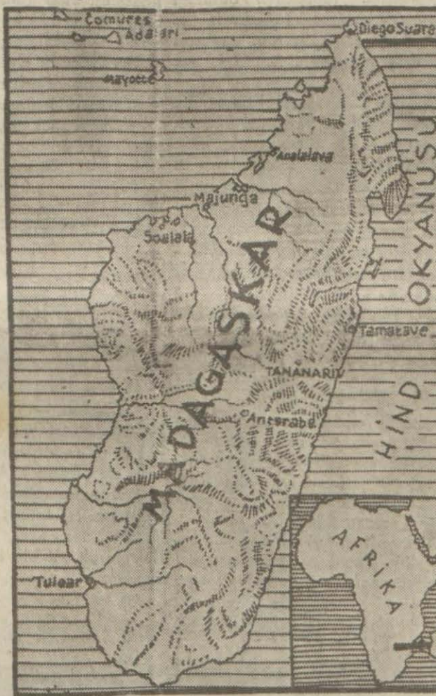
Madagaskar adasını gösterir harita

Adanın baş şehri Tananrive'dir. Diğer mühim şehirler ise Majunga, Antsirabe, Diego Suarez ve Tama-