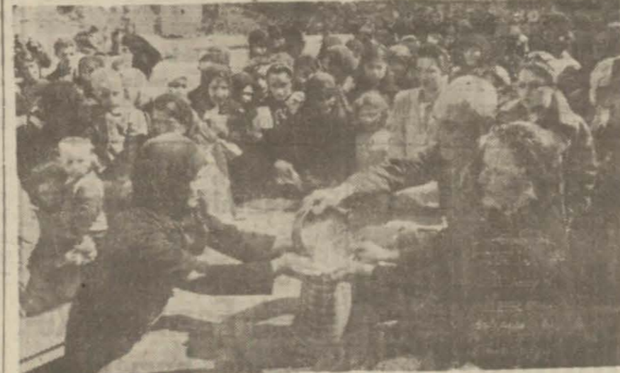
Tevzat esnasında alınan bir resim

Şişli Halkevinin dört aydanberi fakir halka dağıtmakta olduğu erzakın son partisinin tevzâtı dün yapılmıştır. Halkevi reisi ile sosyal yardım şubesinin üyelerinin çalışmaları muhittin toplanan