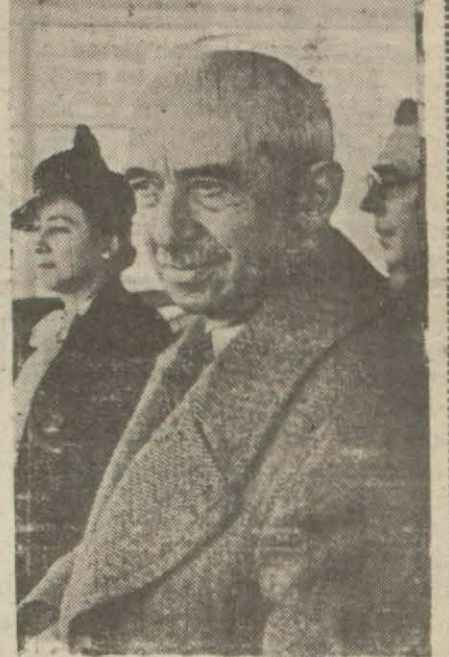
Millî Şef'in Pazar günü at yarışlarında alınmış son resimleri rü Saracoğlu da hazır bulunmuştur.